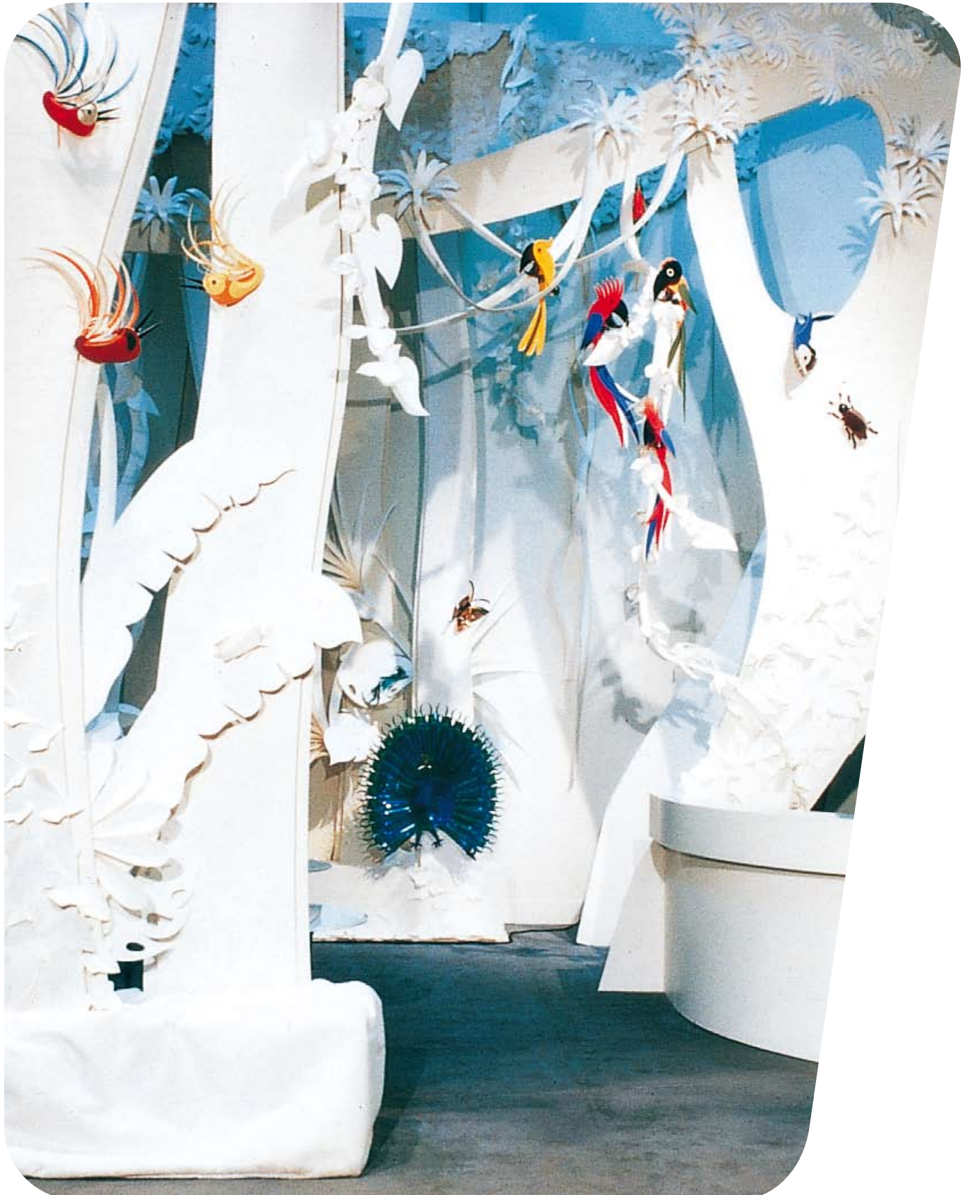
Płyty warstwowe Tusand